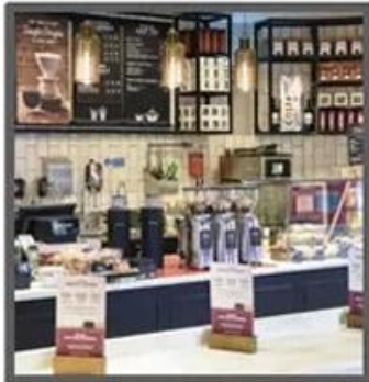
Mile Tea Store